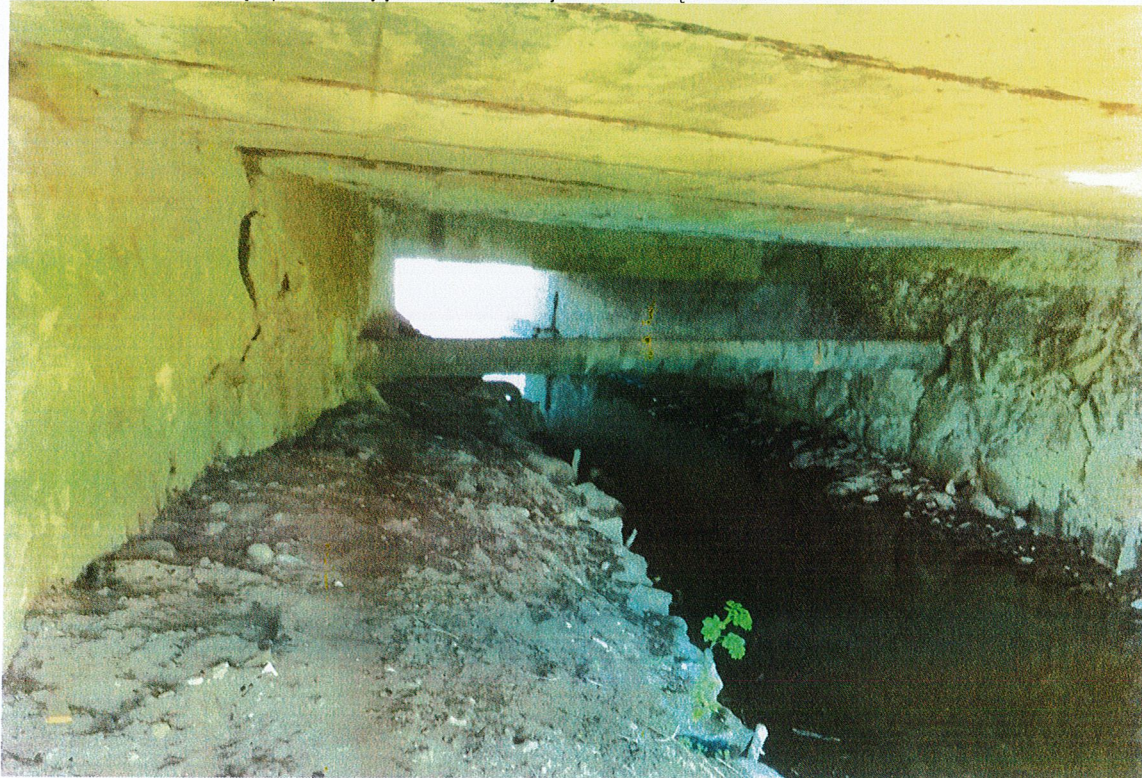
Fot. 2 spód konstrukcji i przyczółek. Widoczne uszkodzenia podstawy posadowienia przyczółka. W części poszerzenia, beton przyczółka ulega poważnej korozji. Wskutek nieszczelnej izolacji płyty pomostu powstają nawisy typu stalaktytowego.