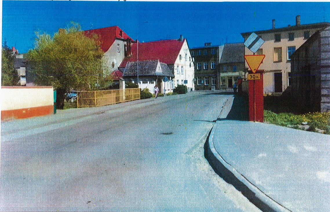
Fot. 1 widok obiektu z poziomu nawierzchni. Nawierzchnia jezdni jest sfalowana, przez co nie jest poprawnie odwodniona. Widoczny po stronie lewej wpust uliczny jest zdeformowany wraz z krawężnikiem.