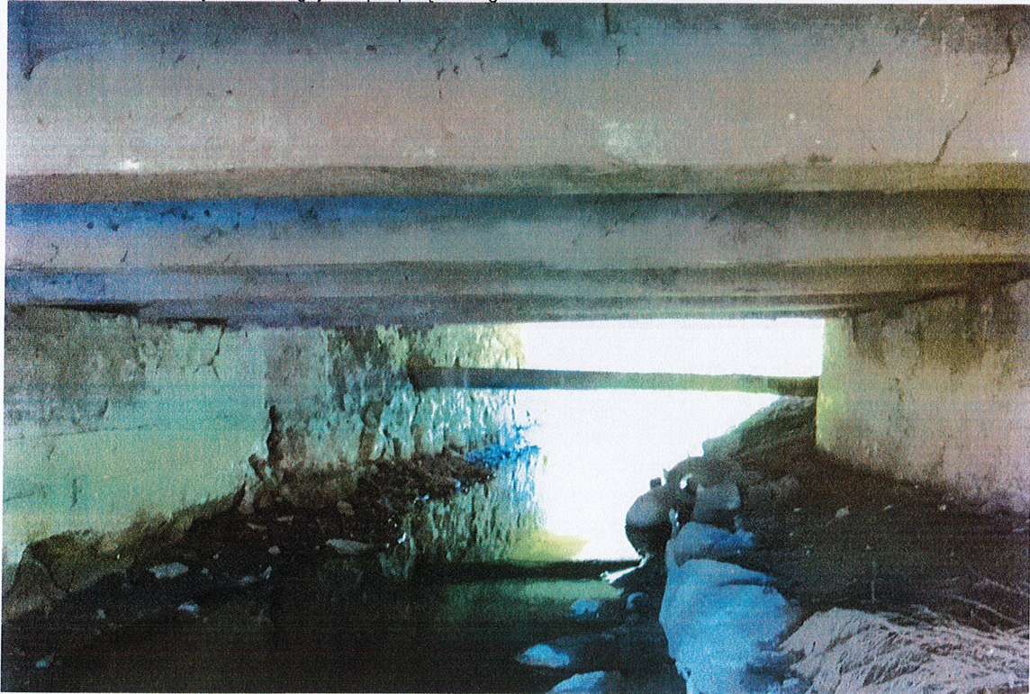
Fot. 4 Fot. 4 uszkodzenia podstawy lewobrzeżnego przyczółka