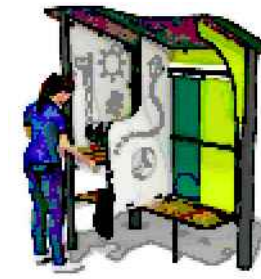
Przebierak dla niemowląt