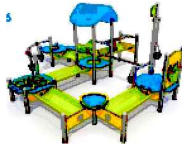
Zestaw zabaw z piaskiem